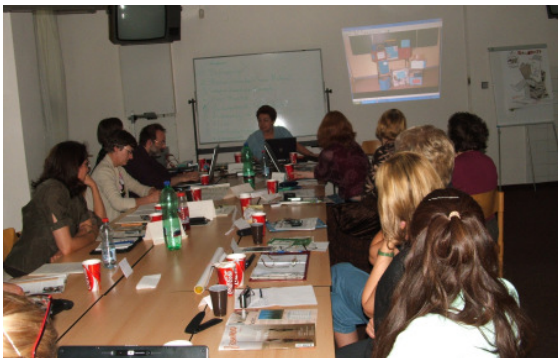
Die TeilnehmerInnen stellen auf einem Projekttreffen in Prag ihre Materialien vor